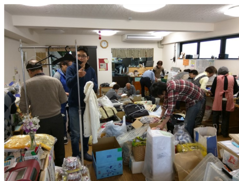
介護用品リサイクルバザー