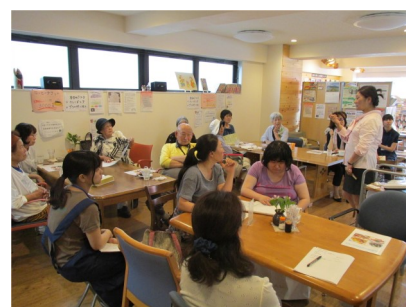
万病のもと糖尿病講座