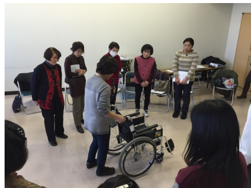
生活援助員養成講座で車イスの操作方法を学ぶ

家族介護者のニーズを具体的に把握できるようになったので、従来の「家庭介護サポーター養成講座」を改編し、傾聴ボランティアを養成する「介護カウンセラー養成講座」、生活支援事業立ち上げに向けた「高齢者・介護者の生活援助員養成講座」を新たに実施しました。