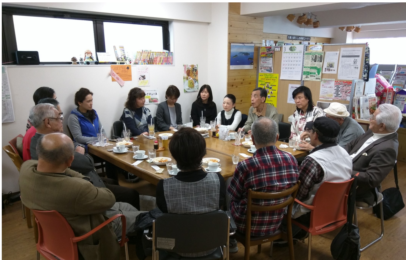
家族介護者のつどい