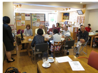
マイナンバー制度ミニ講座