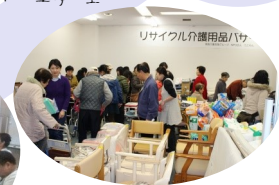
リサイクル介護用品バザー初開催。