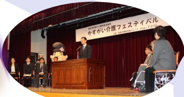
かすがい介護フェスティバル 22団体の出展700名の来場が ありました