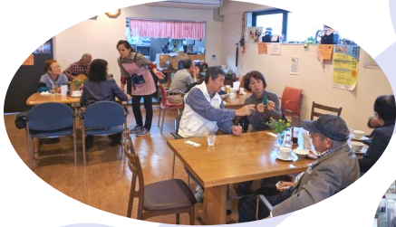
地域の方々に愛され営業中。