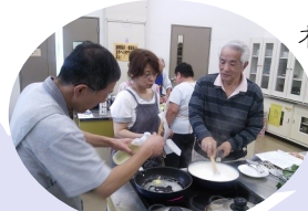
男性介護者の料理教室