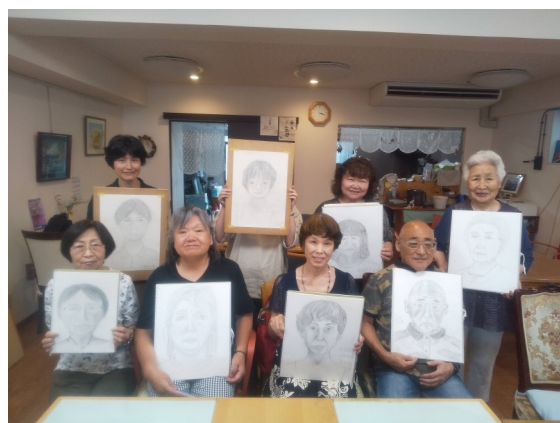
デッサン教室く介護中でも趣味を