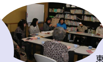
月1回の家族介護者のつどい からスタートしました!