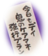
介護川柳。143名243句の 応募があり、冊子にまとめました。