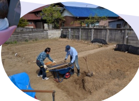
火田づくりは石ころ取りから...