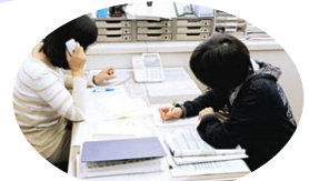
木曜日の電話相談。