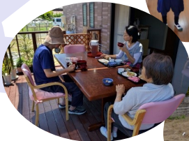
利用者が2人だけの日もありました。