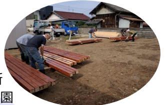
ウッドデッキは手作りです