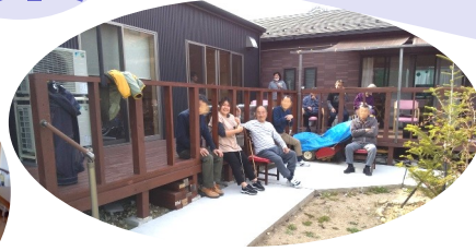
デイサービスはいつでもぎゅわ