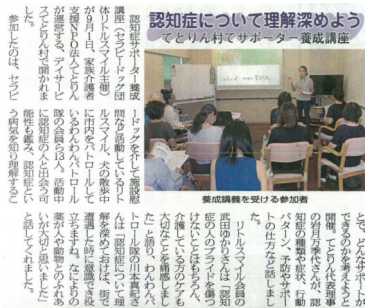
9/26 ぐらしのニュース