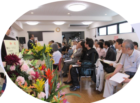
ととりんハウス開所式!