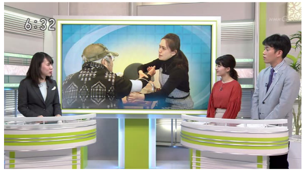
3/12 NHK福井放送局 ニュースザウルス