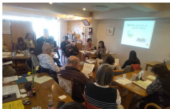
講座 介護者の会のつくり方