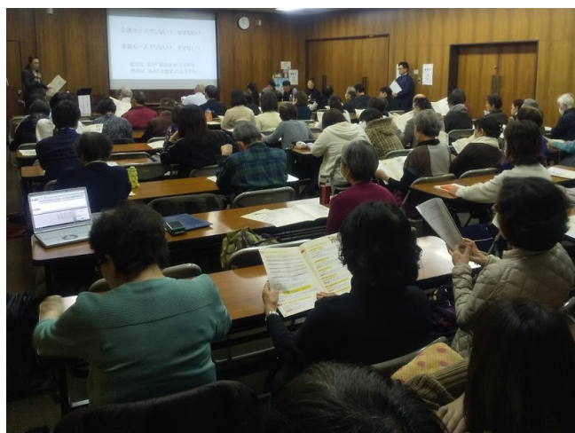
社協主催の講座、介護者3名が介護生活を語りました。