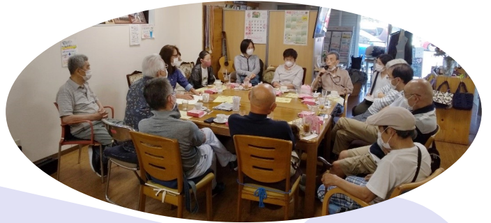
家族介護者のつどい10周年!