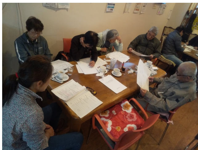
介護者のセルフ・アセスメント。難しい・・・