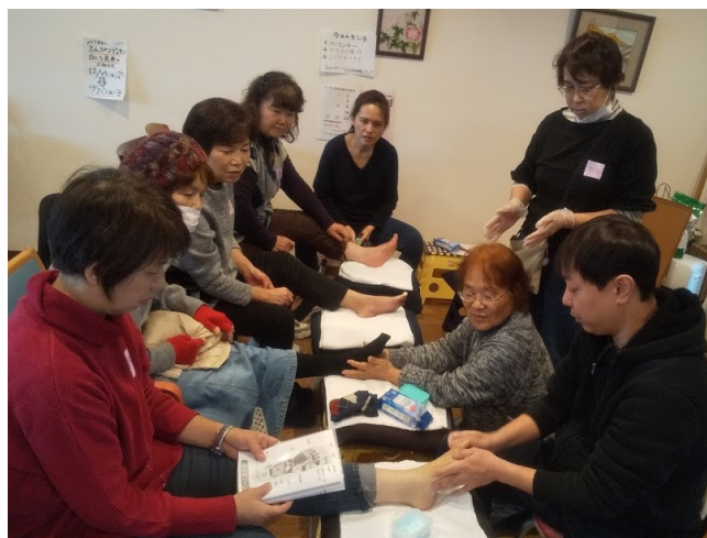
足ツボを習得中。来年はボランティアデビュー！？