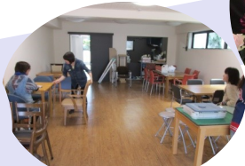
テーブル運び入れ中♪