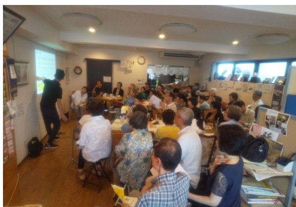
講座 老人ホームいづらかかるの？