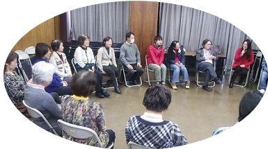
介護者心理の専門家に学びました