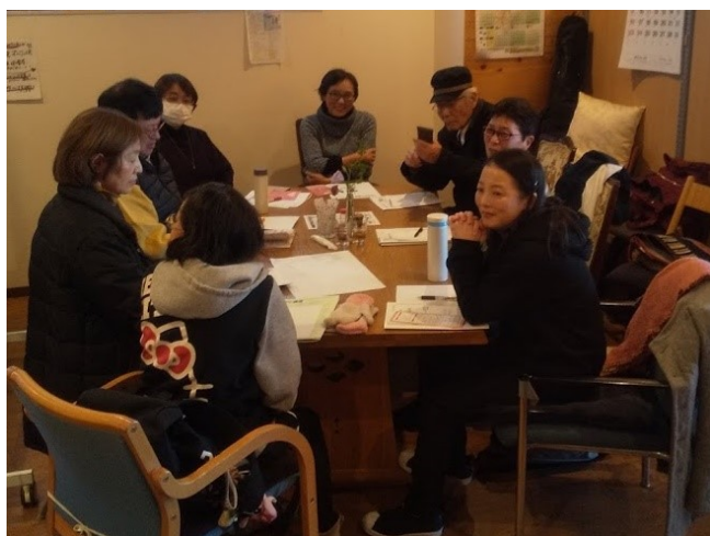
家族介護者のつといを疑似体験、全員話せるかな・・・