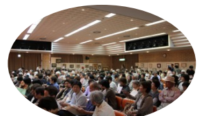
認知症介護の映画「折々毎」上映と原作者講演会。