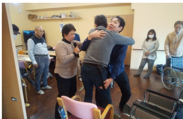
講座 暮らしの中の介助技術