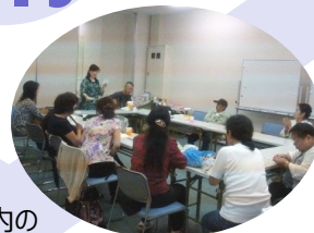
毎週水曜日は 介護おしゃべりサロン♪